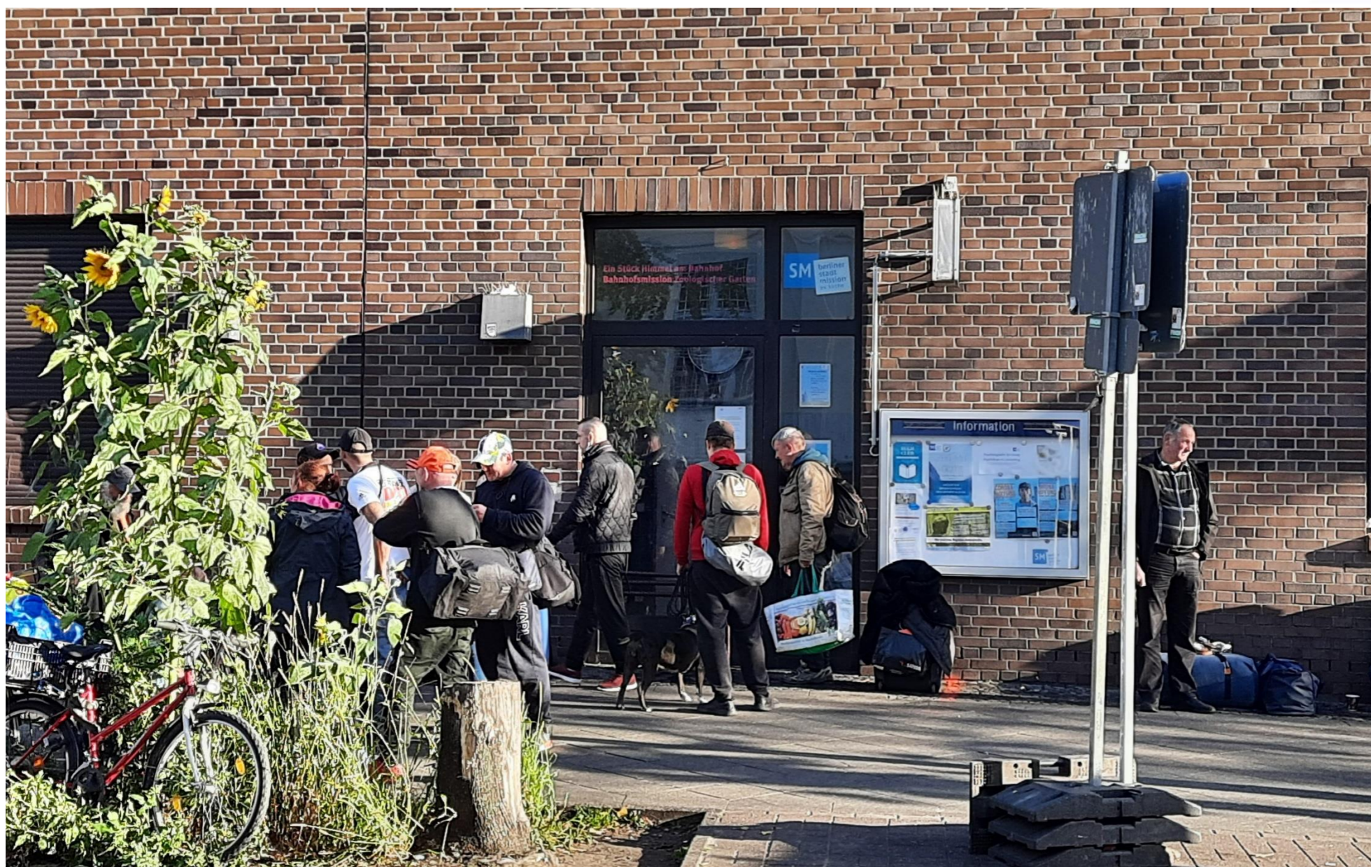
Bahnhofsmission am Bahnhof Zoologischer Garten